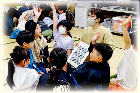
▲読み聞かせボランティアとの交流