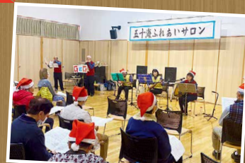
ふれあいサロン活動の支援