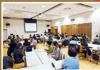
大人のための福祉講座 (福祉教育事業)