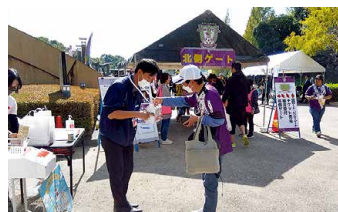
▲藤枝MYFCホームゲーム戦での募金活動

歳末たすけあい募金は、令和5年度に実施した支援を必要としている方への「年越し支援金」事業に活用したほか、令和6年度の地域福祉事業等に活用いたします。