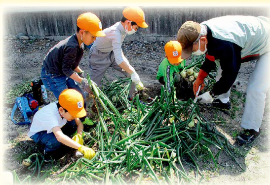
サポーターと一緒に玉ネギ堀り▶