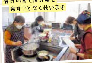
お話と美味しいごはんが 元気の秘訣