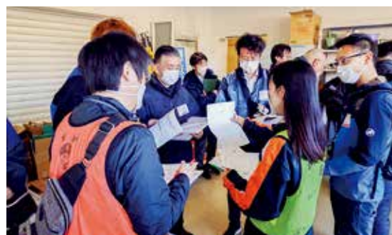
令和7年1月26日、災害時応援協定を結んでいる埼玉県深谷市社協の災害ボランティアセンター運営訓練に参加してきました

能登半島地震から1年が経ちました。昨年、市社協では職員2名を能登に派遣し、能登町災害ボランティアセンターの支援を行いました。復興までの道のりは長いですが、引き続き支援を行うとともに、市内でも災害に備えてさまざまな取り組みを行っています。