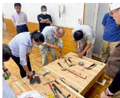
志太榛原広域連携事業として、近隣市町社協と連携し年2回の勉強会を行っています

市社協では今後起こり得る災害に対し、埼玉県深谷市社協、石川県白山市社協、藤枝ライオンズクラブ、藤枝青年会議所、藤枝市協力雇用主会と災害協定を結び連携を図っています