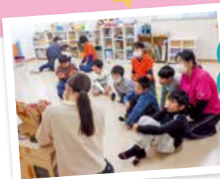
絵本の読み聞かせ みんな真剣な 眼差しで聞いてます

レクリエーション内容を指導員が考えることもありますが、この日は利用者の1人がレクリエーションの内容を企画し、“絵本の読み聞かせ”や“なぞなぞ”“的当てゲーム”を行いました。みんなのとても楽しむ姿が印象的でした。幅広い年齢層のお子様たちが一緒に活動することで、人との関わりやコミュニケーションの取り方を日々の活動を通して学んでいます。