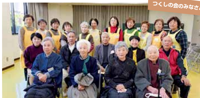
つくしの会のみなさん

広幡地区で昭和63年設立から36年間、地域の方の協力のもと、会食や高齢者の介護予防活動を通じた交流を行い、地域の大切なつどいの場となっていたふれあい会食会「つくしの会」が今年度末をもって惜しまれつつも活動を終了することとなりました。運営に尽力されたボランティアの皆さん、本当にありがとうございました。