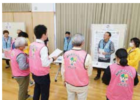
市社協では毎年、地区社協と共催で災害ボランティアセンター運営訓練を開催しています