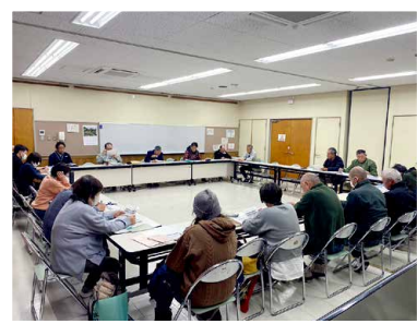
▲瀬戸谷地区社協 行動目標・行動方針策定委員会