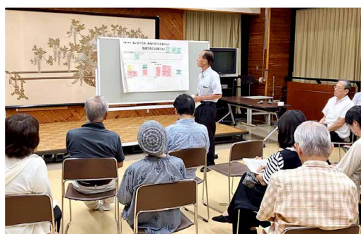
▲青島地区社協 企画委員会