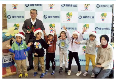
▲岡部聖母幼稚園 様