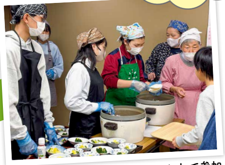
▲近隣の中高生もボランティアとして参加

今回紹介した2つの取り組みは生徒が“地域の一員”という意識を育み、地域や団体と学校が互いを理解し合うきっかけとなりました。こうしたひとつひとつの取り組みがやがて「地域とつながるふくしの輪」となりこれからも広がり続けていきます。