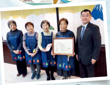
▲授賞式の写真 (右から2番目が関口代表)