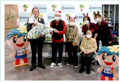
▲きらら藤枝デイサービス 様