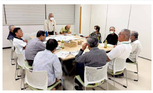
▲葉梨地区社協 地域福祉懇談会