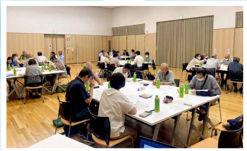
▲藤枝地区社協 地域福祉懇談会