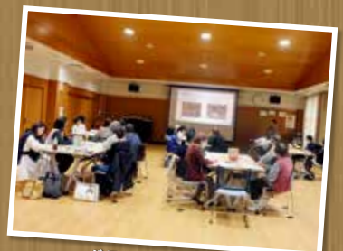
ボランティア交流会