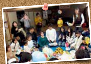
三世代がふれあう 交流活動に