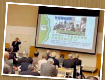
地区社協全体連絡会