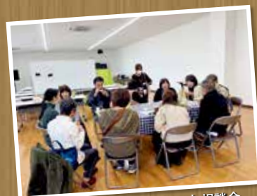
まるっとカフェ・まるっと相談会