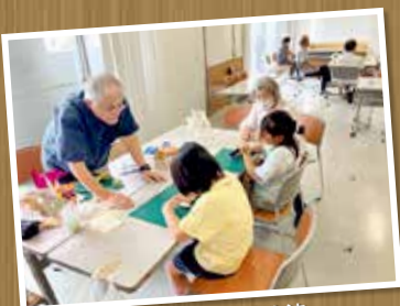
地区社協三代交流

皆さまからいただいた会費は、令和7年度、次のような事業に活用させていただきました