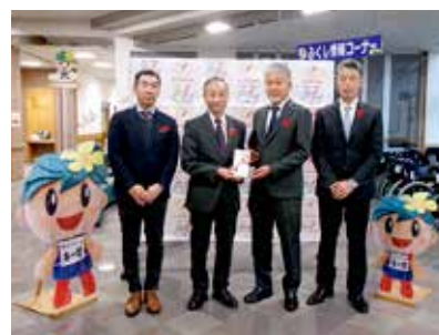
▲藤枝建設業協同組合 様

歳末たすけあい募金は、令和7年度に実施した、支援を必要としている方への「年越し支援金」事業に活用したほか令和8年度の地域福祉事業等に活用いたします。