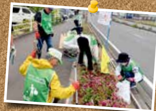
地域で生活する方の 生きがいに