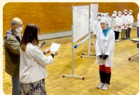
藤枝地区社協から感謝状が贈られました！

みんなの憩いの場だった蓮の実会ですが、惜しまれつつも令和8年3月末で活動は終了となりました。令和8年4月からは新たにふれあいサロン「山ふところサロン」として活動をスタートしています。今後も藤枝地区の高齢者の笑顔のために活動していきます。